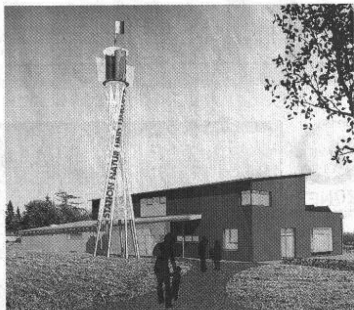
Die neue Station für Natur und Umwelt soll ein Öko-Traum werden – mit Sonnenkollektoren, Solarkocher, Wetterstation und Pflanzenkläranlage. Skizze: STNU